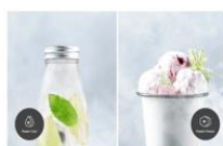
Power Cool / Power Freeze Szybkie chłodzenie i zamrażanie