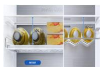
Wielofunkcyjna półka na wino Jeszcze więcej elastyczności przechowywania