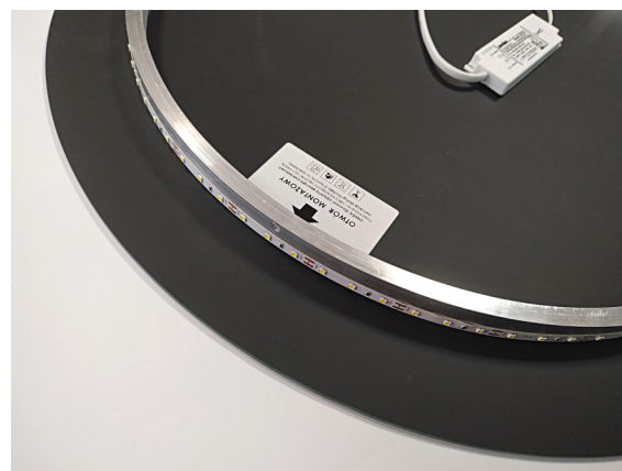
Tył lustra z podświetleniem