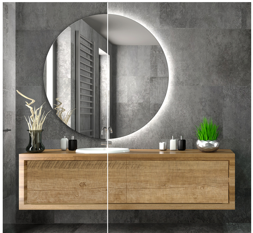
bez podświetlenia LED

Lustro wyposażone w aluminiowy stelaż z podświetleniem LED oraz otworem do montażu. Barwa światła do wyboru w momencie dokonywania zakupu: neutralna (Ok.4000 K), ciepła (Ok.3000 K) lub zimna (Ok..6000 K).